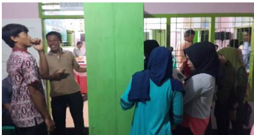
Gambar 5 Pengunjung TBM Cerdas

jumlah total peserta 50 orang. Acara sosialisasi dan peresmian TBM Cerdas berjalan dengan lancar dan mendapatkan sambutan serta antusias yang sangat baik. Ini terlihat dari banyaknya peserta yang hadir dan melihat koleksi TBM Cerdas seperti berikut ini: