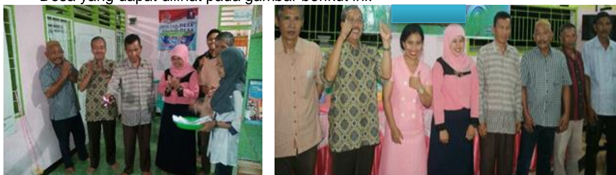
Gambar 6 Peresmian TBM Cerdas Desa Tanjung Terdana

Peresmian TBM Cerdas secara simbolis dengan mengguting pita yang dilakukan oleh Kepala Desa didampingi oleh Tim pengabdian dan perangkat Desa yang dapat dilihat pada gambar berikut ini: