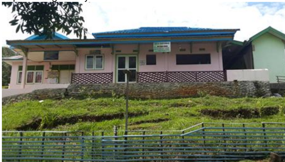
Gambar 1 Balai Desa Tanjung Terdana Pondok Kubang Kabupaten Bengkulu Tengah

Tim pengabdian memilih Balai Desa Tanjung Terdana Pondok Kubang Kabupaten Bengkulu Tengah sebagai tempat berdirinya Taman Bacaan Masyarakat (TBM) karena letaknya yang strategis dan selalu menjadi tempat kegiatan para warga masyarakat.