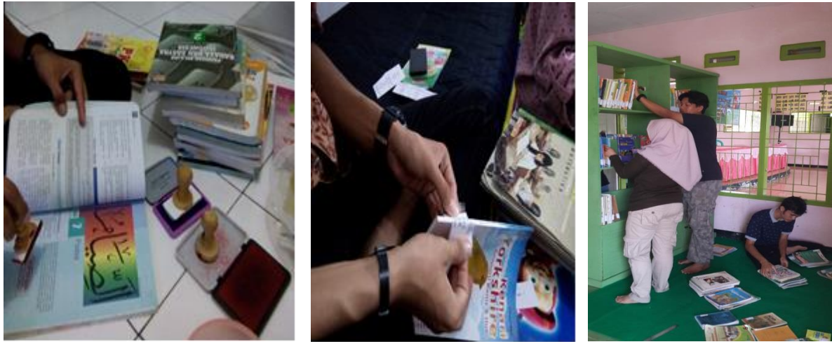
Gambar 3 Proses Pengolahan Koleksi Bahan Pustaka

Setelah semua proses dan tahapan selesai maka yang terakhir adalah penataan ruang dan koleksi TBM agar dapat digunakan dengan nyaman oleh masyarakat. Ruangan TBM ditata sedemikian rupa dengan menggunakan karpet dan meja sehingga masyarakat senang berlama-lama berada di TBM untuk membaca koleksi. Masyarakat dapat dengan mudah menemukan bahan bacaan sesuai dengan klasifikasi bahan bacaan. Berikut ini adalah dokumentasi rak yang telah ditata: