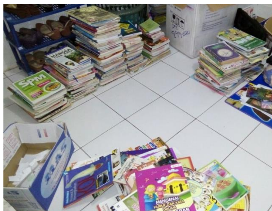
Gambar 2 Koleksi Buku yang akan disumbangkan

Selain membantu dalam pengadaan koleksi buku, tim juga membantu dalam sarana dan prasarana seperti rak buku, karpet, meja baca pengunjung, buku induk, buku sirkulasi, cap inventaris, alat kebersihan untuk bahan pustaka dan ruangan, pulpen, kertas HVS, pulpen, spidol, gunting, isolasi, kertas origami dan masih banyak lagi.